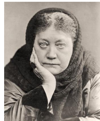
Helena Petrovna Blavatsky

Wie anders könnte man dem evolutiven und spiralförmigen Fortschritt unserer vier Reiche gerecht werden und ihn mathematisch erklären? Die Monade ist die Verbindung der letzten zwei Prinzipien im Menschen und genau gesprochen bezeichnet der Ausdruck »menschliche Monade« nur die duale Geistseele (Atma-Buddhi) und nicht ihr höchstes geistiges und belebendes Atma-Prinzip. Nachdem aber die Geistseele, wenn sie von letzterem (Atma) getrennt ist, keine Existenz, das heißt kein Sein haben könnte, so wurde sie also benannt... Nun ist die monadische oder vielmehr kosmische Wesenheit, wenn ein solcher Ausdruck im mineralischen, vegetabilischen und animalischen Bereich gestattet ist, obwohl sie durch alle Reihen der Entwicklung, vom niedersten elementaren bis zum Deva-Reich, dieselbe ist, doch