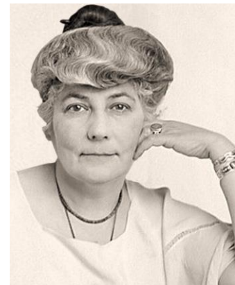
Helena Ivanovna Roerich

Antwort: Jede physische Zelle besteht aus einem Korn und einem Kern, welche dem feurigen Korn und dem Kern des Geistes im Menschen entsprechen. Das feurige Korn im Menschen bleibt als Essenz des reinen Göttlichen Ursprungs ewig unwandelbar und unzerstörbar. Der Kern des Geistes – das höhere Ego des Menschen – wächst und wandelt sich jedoch unbegrenzt, vorausgesetzt, dass es von allen Zentren normale Nahrung empfängt, sofern die psychische Energie die höheren Nervenzentren des Menschen in Tätigkeit versetzt. Und da ein Mensch, als Träger dieses Kerns des Geistes, hier auf Erden durch das Öffnen seiner höheren Zentren und durch die Vergeistigung seines Wesens Fortschritte erzielt, wird er sich gegen Ende des Zyklus oder der vierten Runde unseres Planeten in vollem Bewusstsein in jener Sphäre (Globus) vorfinden, die ihm und seinen angesammelten Energien und Fähigkeiten entspricht. Wenn er in den folgenden Runden das gleiche unverminderte Streben nach Vervollkommenheit bekundet, wird er seine Unsterblichkeit auch für die nächste interplanetare Periode (Kette) bewahren – und unbegrenzt so weiter. Man muss jedoch bedenken, dass sich infolge eines Aufstiegs wie auch eines Abstiegs Veränderungen im Ego ergeben. Dadurch wird nach einem länger anhaltenden Abfall ein erneuter Aufstieg äußerst schwierig sein. ...” (HIR II, 3. Dezember 1937)