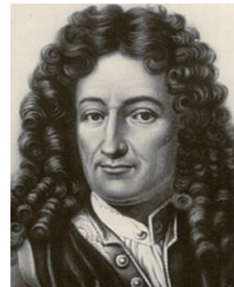
Gottfried Wilhelm Leibniz

Der Okkultismus lehrt dazu, dass die Monaden die führende und treibende Rolle bei der Transmutation der Materie in Geist übernommen haben. Sie sind aber mit dem Menschen selbst nicht identisch, sondern gewissermaßen sein Führer aus einer höheren Ebene, der in den menschlichen Bereich selbst nur teilweise herabsteigen kann und deshalb mit Hilfe eines verlängerten Armes, das ist das höhere Ego, die Persönlichkeit durch Individuation gestaltet.