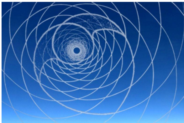
Bewegungsprinzip des Heiligen Geistes

Entwicklung von individuellem Leben bedeutet daher für das Individuum einen zeitlichen Anfang und ein zeitliches Ende. Darum sprechen wir heute von einer relativ unsterblichen Geistseele. Relativ deshalb, weil alles Leben im materiellen oder relativen Bereich der Auflösung unterliegt. Was jedoch nicht vergeht und nicht aufgelöst werden kann, ist die Energie an sich, die eine Seele bis zur höchstmöglichen Potenz in sich aufspeichert bzw. aufspeichern kann, und zwar aufgrund des Gesetzes der Erhaltung der Energie. Deshalb kann man sagen, dass die Energie der menschlichen Seele unsterblich ist. Die Energie kann nie vergehen, sondern hält das universelle Kraftfeld (UNIVERALO, siehe Lektion Nr. 29 ab 3. Auflage)