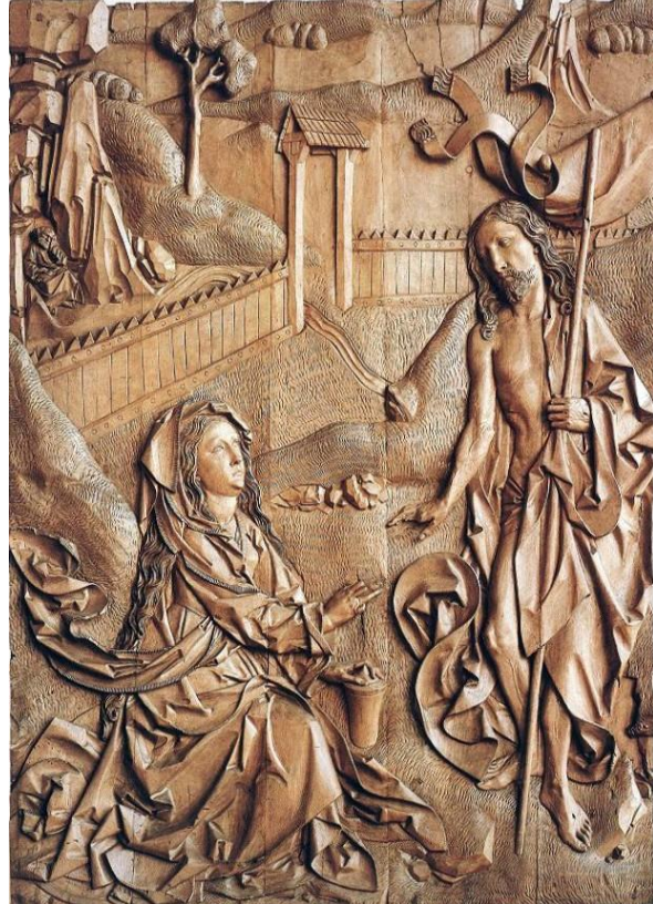
„Ne me touche pas!“, de Tilman Riemenschneider

N'importe quel médecin généraliste sait combien de tension électrique peut supporter le cœur humain, alors que l'intensité des forces ardentes dépasse de manière incomparable celle de l'électricité conventionnelle. Même les apparitions du fohat ne peuvent pas toujours se révéler à l'œil nu ! Alors comment les visiteurs de Feu pourraient-ils apparaître plus souvent ? Les gens indisciplinés essayent soit de toucher la créature sacrée ou alors ils brûlent carrément de peur. N'oublions pas que le cœur peut brûler de peur. Même lors de la pratique des incantations de la magie blanche, les invités de Feu doivent garder une certaine distance autour du prier, afin de le protéger des courants ardents. Un cœur qui présente déjà des signes de flamboiemment se trouve en mesure de l'absorber progressivement. » (Le monde du Feu I, § 337)