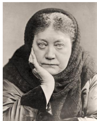
Елена Петровна Блаватская

“Никакого, ни к атому, ни к молекуле, как они существуют сейчас в научном представлении. Она никогда не может быть сравниваема с микрокосмическими организмами, которые были причислены, однажды, к полигастрическим инфузориям, теперь же рассматриваются, как растения, и причислены к водорослям; также она не есть вполне Монада перипатетиков. Физически или в строении своем Минеральная Монада отличается, конечно, от Человеческой Монады, которая не является физической, и строение ее не может быть передано химическими символами и элементами.