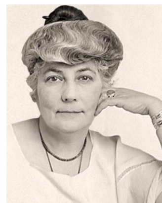
Елена Ивановна Рерих

Ответ: В каждой физической клетке имеется зародыш и ядро, которые соответствуют в человеке огненному зерну и ядру духа. Так огненное зерно в человеке, будучи основой чистого Божественного Начала, остается неизменным и нерушимым в вечности. Ядро духа или высшее Эго в человеке растет и изменяется в беспредельности , при условии, что оно получает нормальное питание от всех центров. То есть, если психическая энергия приводит в действие высшие нервные центры человека. И если человеку, носителю ядра духа, удастся здесь, на Земле, одухотворить свою сущность через открытие своих высших центров, то по окончании цикла, или четвертого круга, нашей планеты, он будет пребывать в соответствующей ему сфере в полном сознании и при всех накопленных им энергиях или способностях. Если и в следующих кругах он проявит ту же неослабную устремленность к совершенствованию, то он точно так же сохранит свое бессмертие и на последующий междупланетный период, и так в беспредельность. Но нужно помнить, что изменения в ядре духа могут происходить как в сторону восхождения, так и в сторону падения. Но невероятно труден подъем после длительного падения. ...” (Письма Е. И. Рерих, 03. 12. 1937)