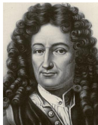
Готфрид В. Лейбниц

поднимать материю через целый ряд градаций различных монад с возрастающей ясностью сознания и усложняющимися формами из царства минералов в сферу Архангелов, или Херувимов, - называемых в эзотерической литературе ДхианКоганами. Человек в этом ряду градаций является лишь промежуточным звеном, частью Творения, в котором уже проявляется определенная форма духа.