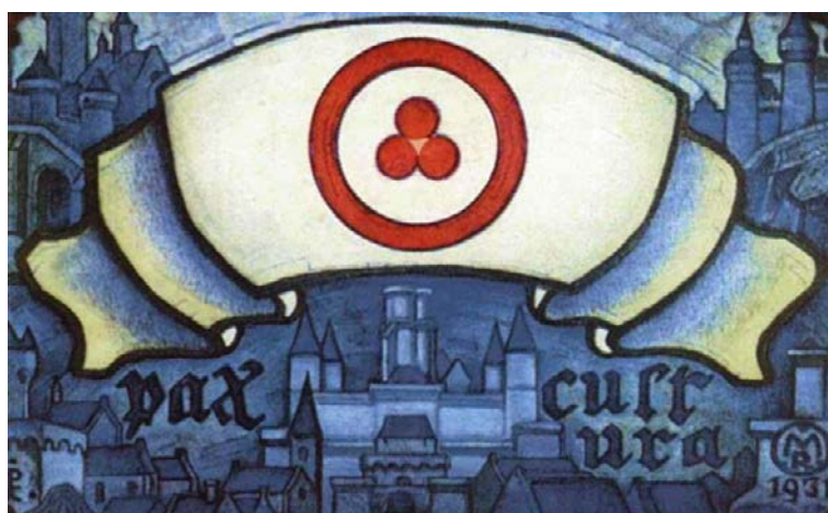
картина Н.К.Рериха: «Мир через Культуру»

«Не может быть международного соглашения и взаимного понимания без культуры. Не может народное понимание объять все нужды эволюции без культуры. Поэтому Знамя Мира вмещает все тонкие понятия, которые приведут народы к понятию культуры. Человечество не умеет явить уважение к тому, что есть бессмертие духа. Знамя Мира даст понимание этого великого значения. Не может человечество процветать без знания величия культуры. Знамя Мира откроет врата к лучшему будущему. Когда страны на пути к разрушению, то даже малодуховные должны понять, в чем заключается восхождение. Истинно, спасение в культуре. Так Знамя Мира несет лучшее будущее.» (ИЕРАРХИЯ, § 331.)